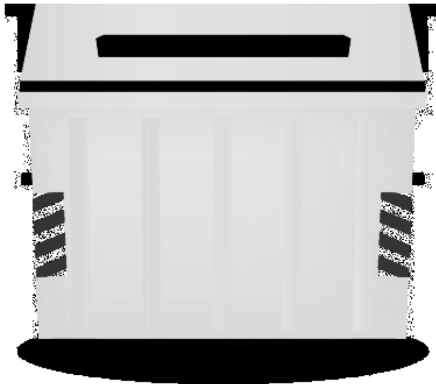
Contenitore facoltativo per grandi utenze