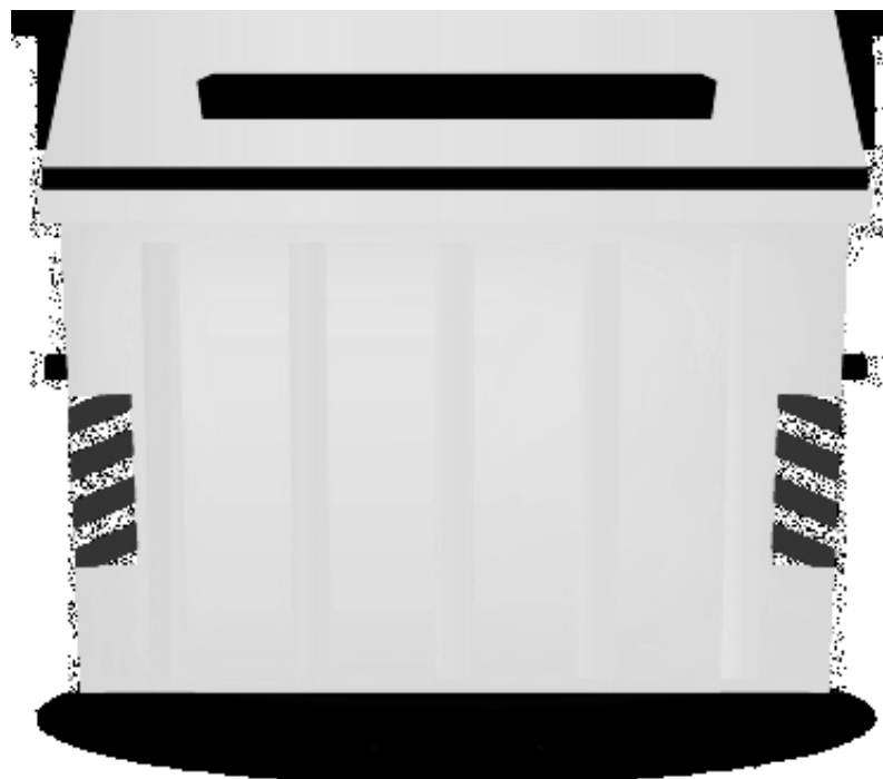
Contenitore facoltativo per grandi utenze