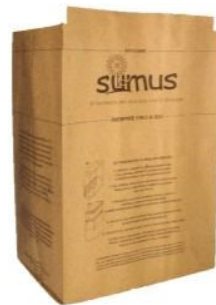
Bidone da 10 litri sottolavello + fornitura sacchetti in carta