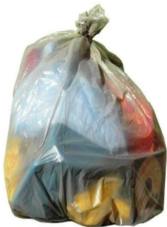
Sacchi da 110 litri