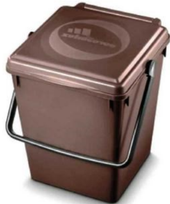
Bidone da 25 litri