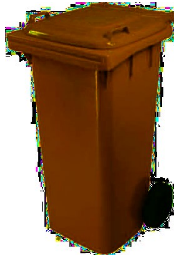
Bidoni carrellati da 120/240 litri