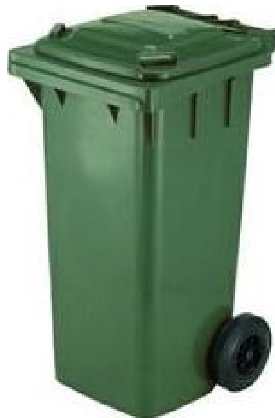
Bidone carrellato da 120/240 litri