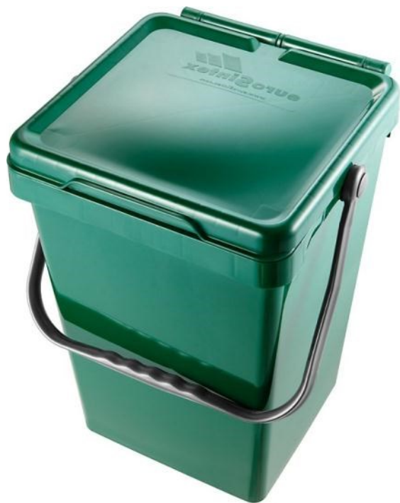
Bidone da 25 litri